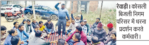
रेवाड़ी। कोसली बिजली निगम परिसर में धरना प्रदर्शन करते कर्मचारी।

कोसली। पुलिस ने संदिग्ध हालत में विवाहिका की मौत के बाद दर्ज दहेज हत्या के मामले में एक आरोपी को गिरफ्तार किया है। पुलिस ने विवाहित की मौत के बाद मायके पक्ष के बचान पर गत 8 दिसंबर को दहेज हत्या का केस दर्ज किया था। मायके पक्ष ने विवाहिका के ससुराल वालों पर दहेज के लिए प्रताड़ित करने के आरोप लगाए थे।