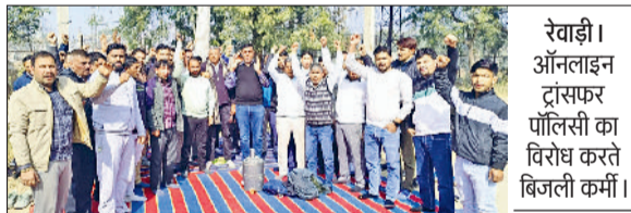
रेवाड़ी। ऑनलाइन ट्रांसफर पॉलिसी का विरोध करते बिजली कर्मी।

टीएल सब यूनिट और सब अर्बन सब यूनिट एचएसबी बैंकर्स यूनियन ने मंगलवार को ऑनलाइन ट्रांसफर पॉलिसी के विरोध में दो घंटे का धरना-प्रदर्शन किया। एचएसबी बैंकर्स यूनियन की प्रदेश समिति की ओर से एसीएस फौवर को पहले ही ऑनलाइन पॉलिसी को निरस्त करने को लेकर आग्रह दिया जा चुका है। यूनियन के पदाधिकारियों ने कहा कि अगर निगम ऑनलाइन पॉलिसी को निरस्त नहीं करता है तो पहले सब