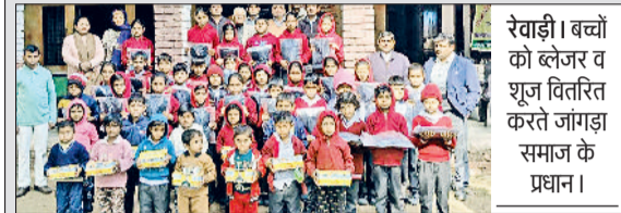
रेवाड़ी। बच्चों को ब्लेजर व शूज वितरित करते जांगड़ा समाज के प्रधान।