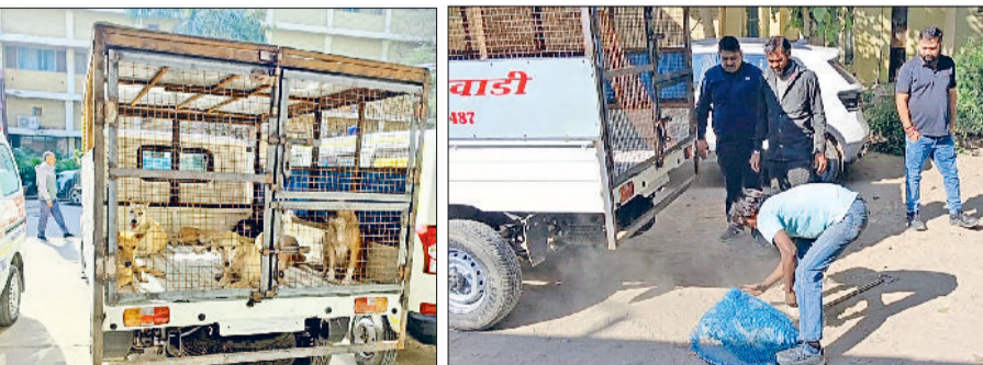
रेवाड़ी। नागरिक अस्पताल से पकड़े गए आवारा कुत्ते तथा आवारा कुत्ते पकड़ती टीम।

शहर में लगातार बढ़ रही आवारा कुत्तों की संख्या पर नियंत्रण के लिए नगर परिषद की ओर से कुत्तों की नसबंदी का काम शुरू कर दिया है। नगर परिषद की ओर से कुत्तों की नसबंदी के लिए 45 लाख रुपये का टेंडर किया गया है। शहर में तीन हजार के करीब कुत्तों की नसबंदी की जाएगी। नगर परिषद की ओर से स्नेह एनीमल वेलफेयर ट्रस्ट फर्म को आवारा कुत्तों के टीकाकरण व नसबंदी के कार्य का ठेका दिया गया है। फर्म