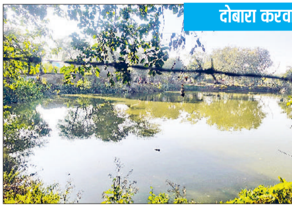
रेवाड़ी। गांव के गोसाईं वाले जोहड़ का अधूरा हिस्सा तथा जोहड़ की जमीन पर किया हुआ अतिक्रमण।