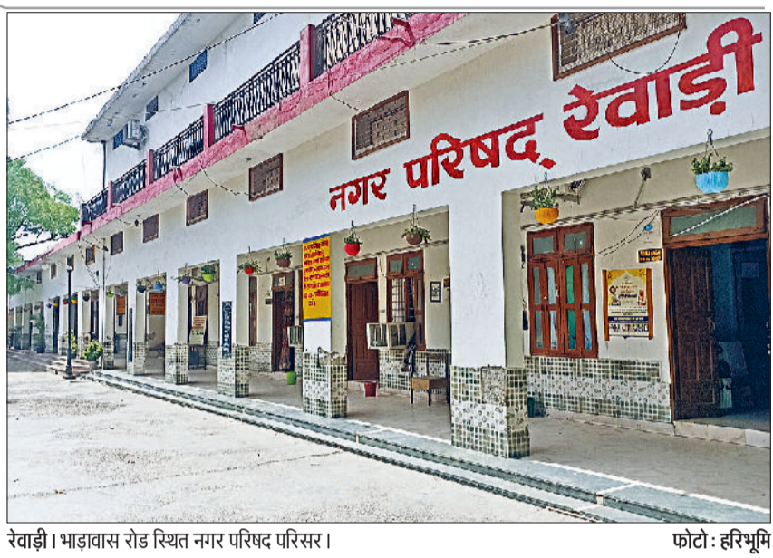
रेवाड़ी। भाड़ावास रोड स्थित नगर परिषद परिसर।

नोटिस 10-10 बकायादारों को दिए जा रहे हैं। एक बार में 10 लोगों की बिल्डिंग सीज करने का प्लान बनाया गया