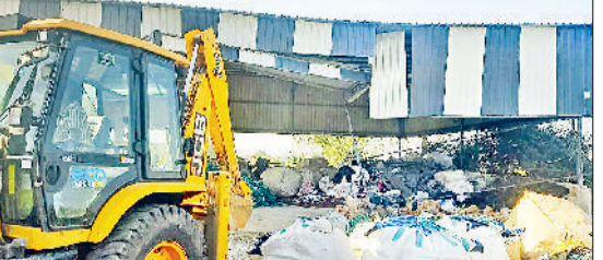
रेवाड़ी। अवैध रूप से बनाए गए निर्माण तोड़ती जैसीवी।

कॉलोनी में 5 डीपीसी, 2 तोड़फोड़ की कार्रवाई की। इसके अलावा डीटीपी की टीम ने गांव