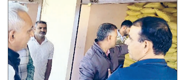
रेवाड़ी। बीज भंडार पर यूरिया का स्टॉक चैक करती टीम।

सीएम फ्लाइंग व कृषि विभाग की टीम ने मंगलवार को धारुहेड़ा क्षेत्र के गांव आंकेड़ा में बीज भंडार की दुकान का निरीक्षण किया। जांच में दुकान पर पीओएस मशीन के अनुसार स्टॉक से यूरिया के 46 बैग कम मिले। दुकान पर स्टॉक रजिस्टर व डिस्पले बोर्ड भी लगा हुआ नहीं मिला। कृषि विभाग ने